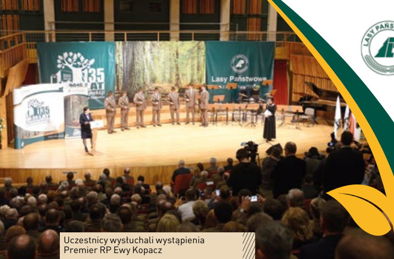
Uczestnicy wystuchali wystąpienia Premier RP Ewy Kopacz

135. rocznicę powstania radomskiej dyrekcji leśnicy świętowali 26 marca podczas uroczystej konferencji w Sali Koncertowej Zespołu Szkół Muzycznych im. Oskara Kolberga w Radomiu.