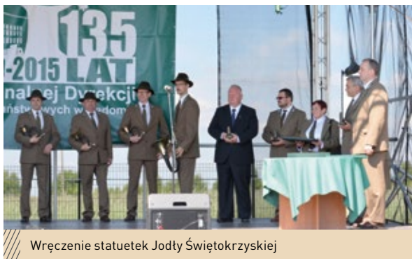
Wręczenie statuetek Jodły Świętokrzyskiej

Nadleśnictwo Ruda Maleniecka ma nową siedzibę. Uroczyste otwarcie biura w Radoszycach oraz zorganizowana wspólnie z samorządowcami konferencja w Maleńcu odbyły się 1 czerwca. Dzień Dziecka leśnicy uczcili festynem z wieloma atrakcjami dla najmłodszych.