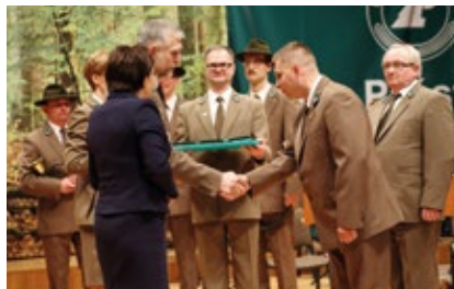
Odnaki honorowe „Za Zasługi dla Ochrony Środowiska i Gospodarki Wodnej” wręczyli premier i minister środowiska