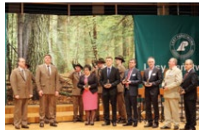
Odnaczeni Statuetką Jody Świętokrzyskiej