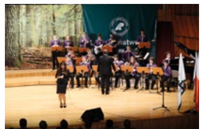
W części artystycznej wystąpił zespół Big Band