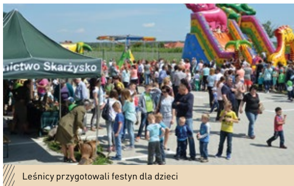
Leśnicy przygotowali festyn dla dzieci