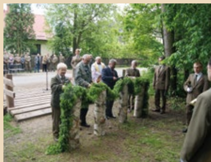
Nowa ścieżka przyrodniczo-leśna otwarta!