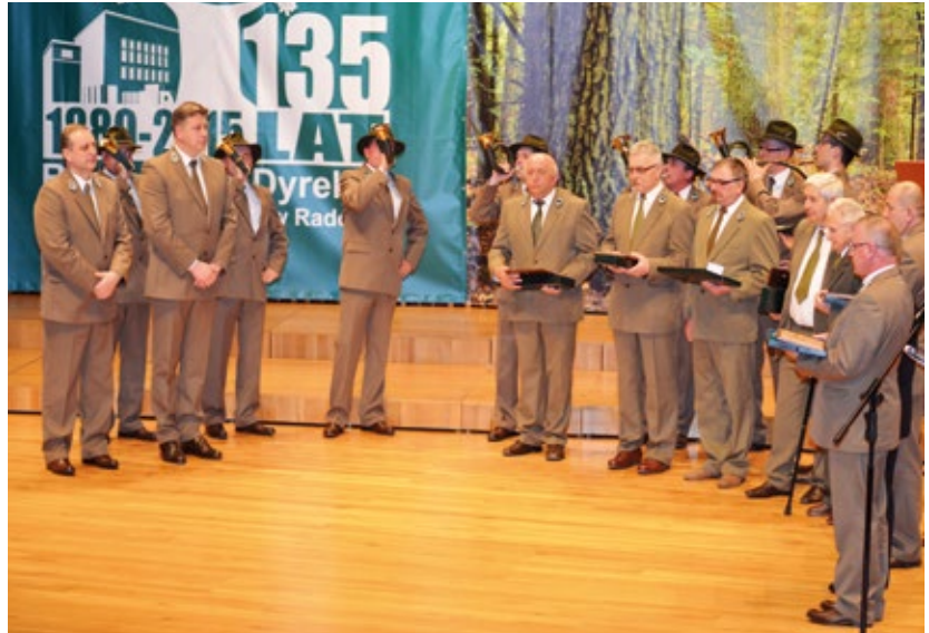
Odnaczeni Kordelasem Leśnika Polskiego